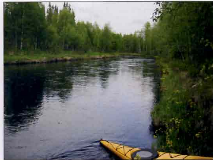
Kuolajoki kulkee Mukkalasta Saijaan pääosin metsässä.