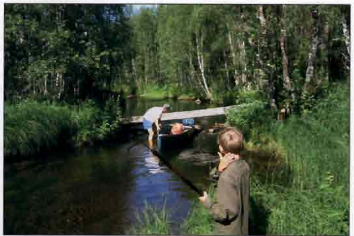
Aatsinkijoen kapeilla latvoilla kannattaa varautua raivaustöihin.

Savukosken kunnasta on saatavissa Tenniöjoen melontakarttaa (1:50 000), jossa näkyvät Tenniöjoki, Kuolajoki, Aatsinkijoen alaosa, Maltiojoen alaosa sekä Pyhäjoen alaosa. Lisäksi Savukosken kunnasta on saatavissa melontakartat (1:50 000) Maltiojoen yläosasta ja Pyhäjoesta.