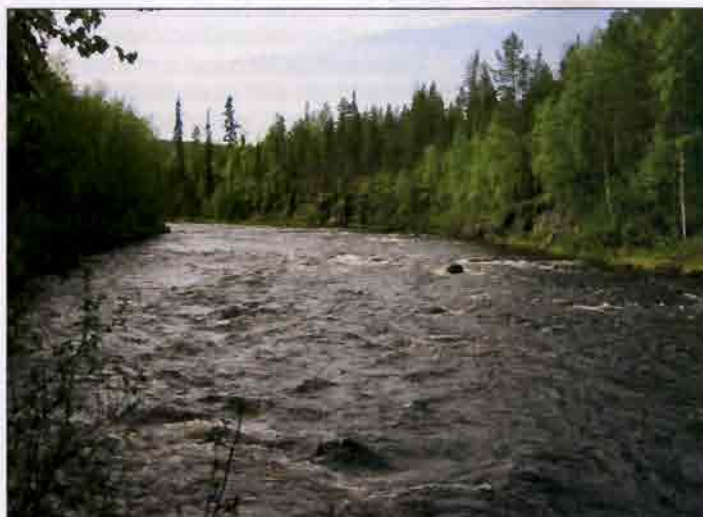
Tenniöjoen kosket eivät ole vaikeita laskea.

keen Tenniöjokeen yhtyy Naruskajoki, joka on suunnilleen samankokoinen kuin Tenniö mutta huomattavasti koskisempi ja kivisempi ja siten suositeltavissa vain korkealla vedellä melottavaksi. Tenniöjoki säilyttää myös vedenkorkeutensa tasaisempaan kuin Naruskajoki, koska Venäjän puolen suuret järvet toimivat vesivarastoina. Jokien yhtymäkohdassa on hyvää hiekkamaastoa telttailuun