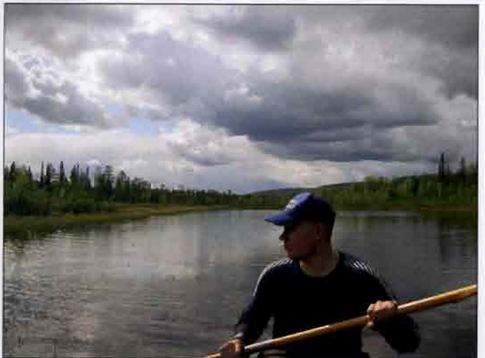
Koutalampi on takana, aletaan lähestyä Aatsinginjärveä.