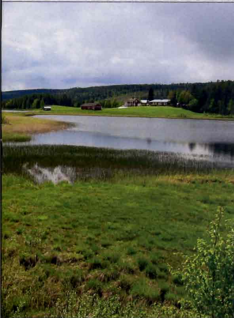
Aatsinkijoen kaunein osuus päättyy monien mielestä Aatsingin kylään.

alueiden kaukana teistä ja asutuksesta. Mieleen painuvat aapasuot, paikoin runsaana joen pohjaa peittävät vesikasvit sekä jokivarren keltainen nauha rentukka-aihana.