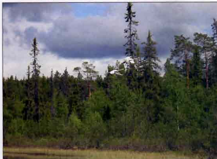
Laulujoutsenia, poroja, hirviä – jopa saukkoja voi nähdä Aatsingilla.

MONEN MIELESTÄ Aatsinkijoen kaunein osuus päättyy Aatsinginkylään (tammelta 15 km). Aatsinkijoen alaosa (40 km) ei kuitenkaan kannata jättää kulkematta, sillä oman tunnelmansa tarjoaa matkata koko joki Saijan kylään asti halki suurten soidensuojelu-