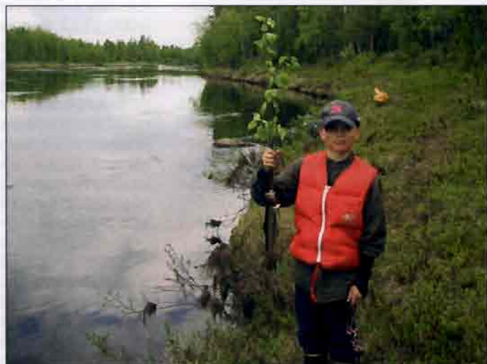
Tenniön tammukka – maistuis varmaan sullekin...